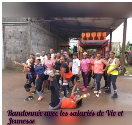
Randonnée avec les salariés de Vie et Jeunesse