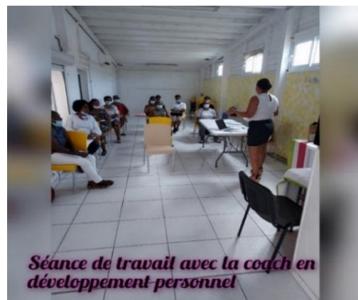
Séance de travail avec la coach en développement personnel