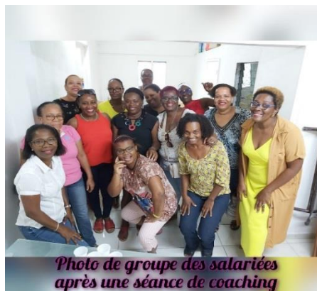
Photo de groupe des salariées après une séance de coaching