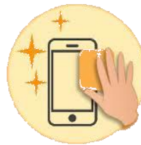
Désinfection régulière des objets et des surfaces

→ Nettoyer les surfaces de contact (table, chaise, poignées, télécommande, etc.). Les produits de nettoyage habituels peuvent être utilisés.